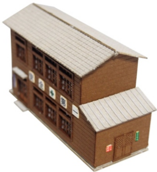
組立例（素組・未塗装）